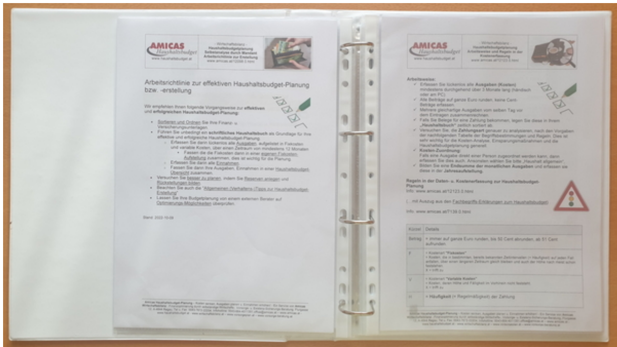
Serviceordner zur Haushaltsbudget-Planung von Amicas Wirtschaftsbilanz, (Ringordner, Format A4 - Kunststoff) - Zustand: Offen